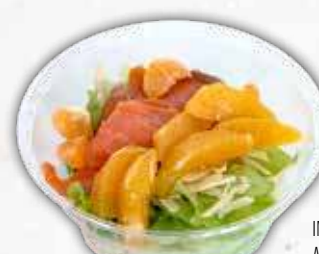
INSALATA SALMONATA AGLI AGRUMI