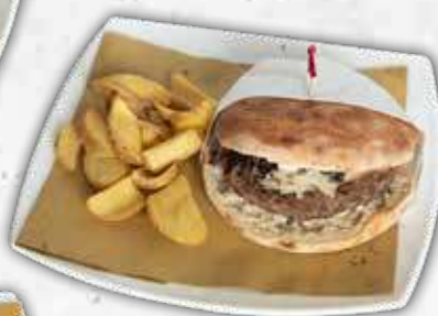
CHEESE BACON EGG BURGER