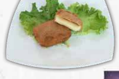
MOZZARELLA IN CARROZZA