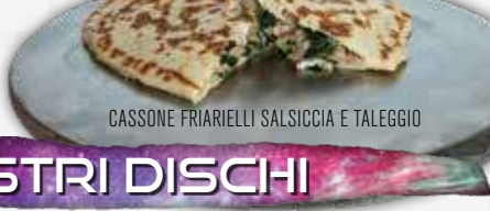
CASSONE FRIARIELLI SALSICCIA E TALEGGIO