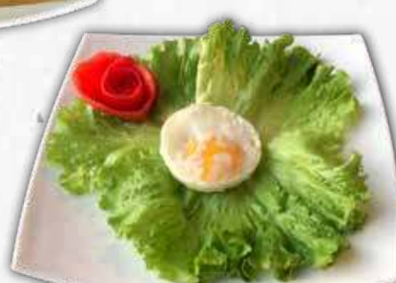
EXTRA EGG puoi aggiungerlo ad ogni hamburger!